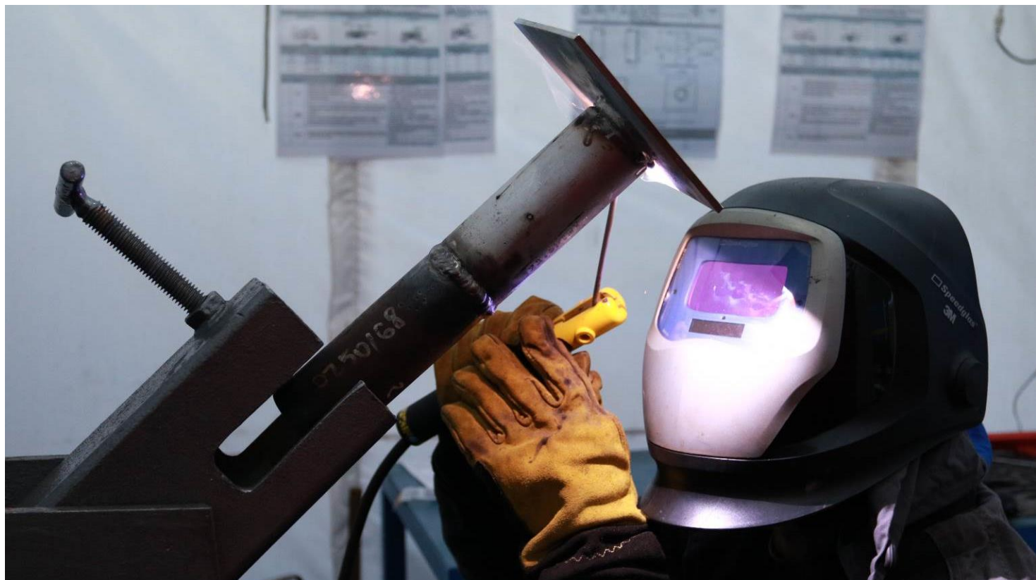
Ручная дуговая сварка (РД, 111) электродами с кислорутитовым покрытием марки ОК 61.30 (ESAB, Швеция) классификации E308L-17 по AWS A5.4 таврового соединения трубы (патрубок) Ø 57×5,0 мм из стали 12Х18Н10Т с пластиной 150×150×5,0 мм из стали СтЗсп в наклонном положении (труба неповоротная) сварка снизу-вверх (Н-L045) под углом 45°