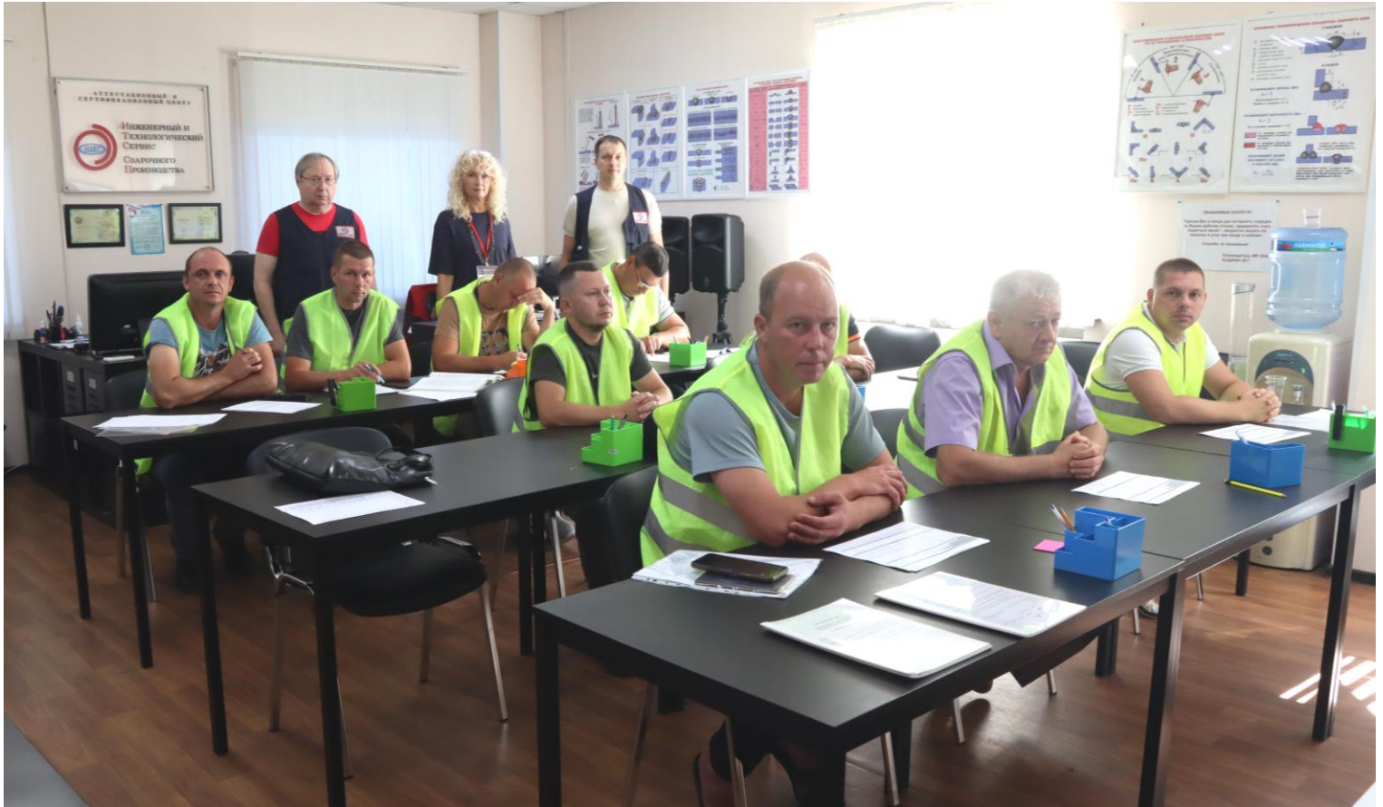
Ознакомление с «Правилами проведения независимой оценки квалификации», проведение инструктажей по пожарной безопасности, по охране труда, в формате мультимедиа (фото-, видео-, аудио- материалы)