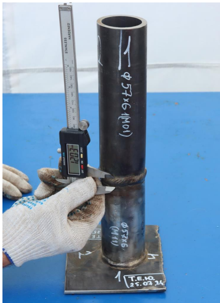
Визуальный и измерительный контроль (ВИК) кольцевых стыковых и тавровых соединений сварных конструкций, выполненных на практическом этапе профессионального экзамена