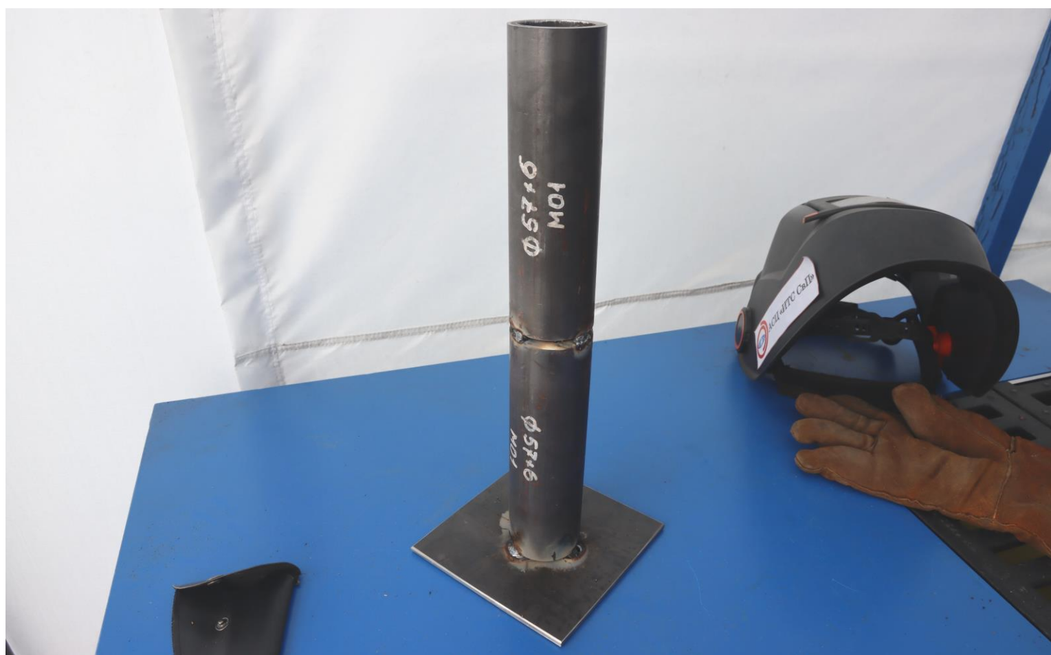
Сборка конструкции КСС под сварку: