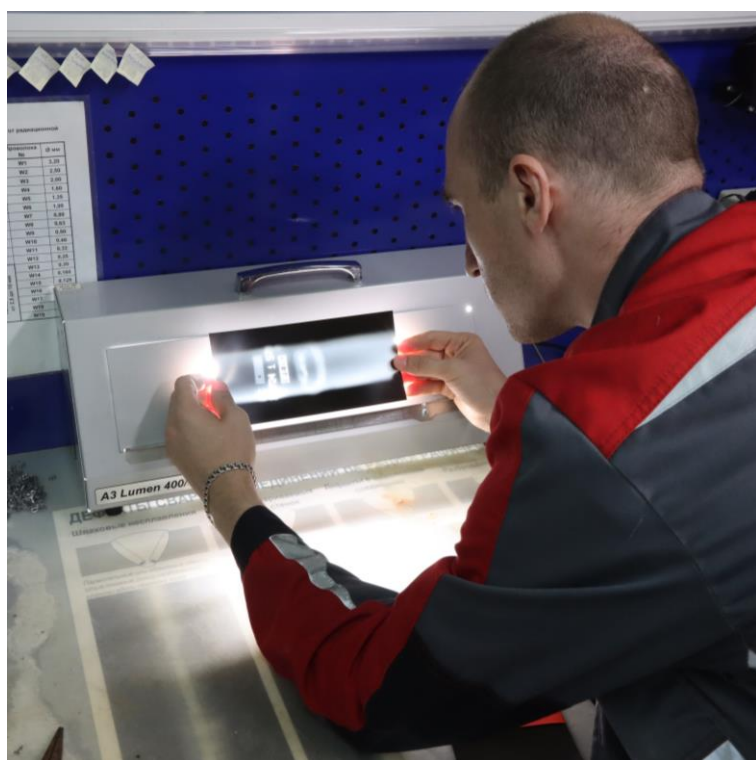
Рентгенографический контроль (РК) кольцевых стыковых и тавровых соединений сварных конструкций, выполненных на практическом этапе профессионального экзамена