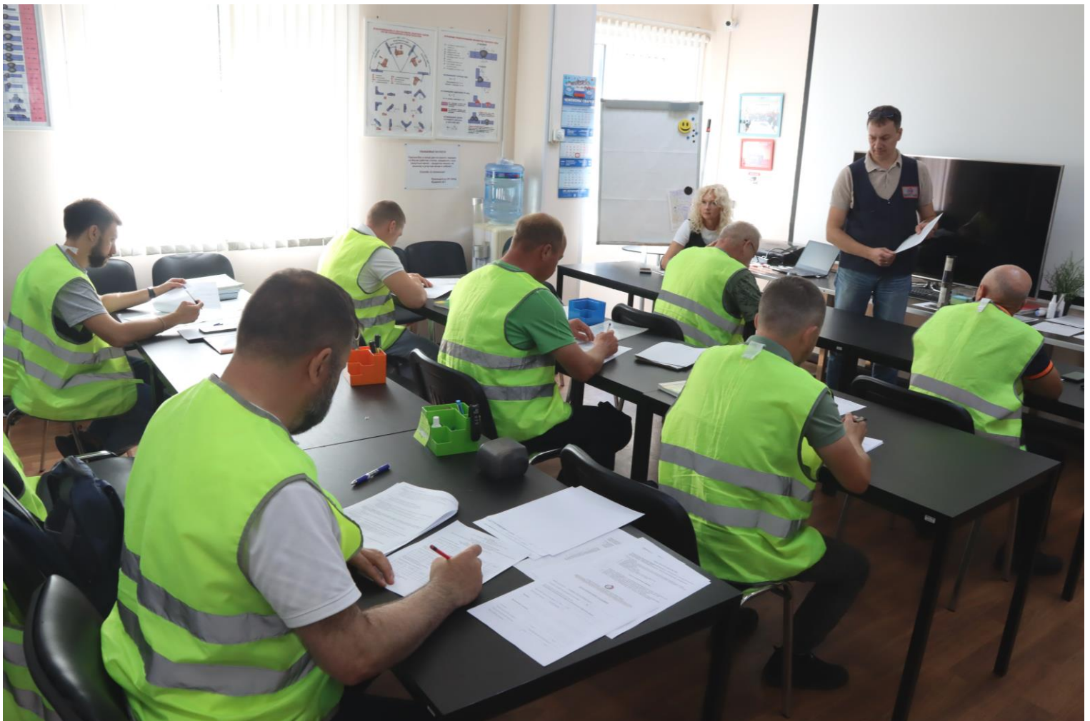
Проведение теоретического этапа профессионального экзамена сварщиков, проверка теоретических знаний сварщиков в формате тестов и практических вопросов