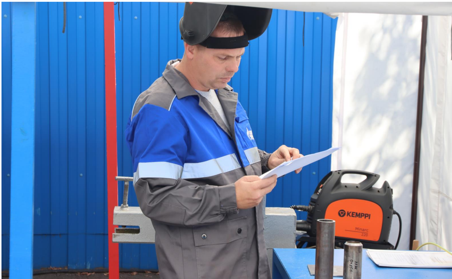
Ознакомление сварщиков с операционными технологическими картами сборки и сварки контрольных сварных соединений при выполнении практического этапа профессионального экзамена независимой оценки квалификации