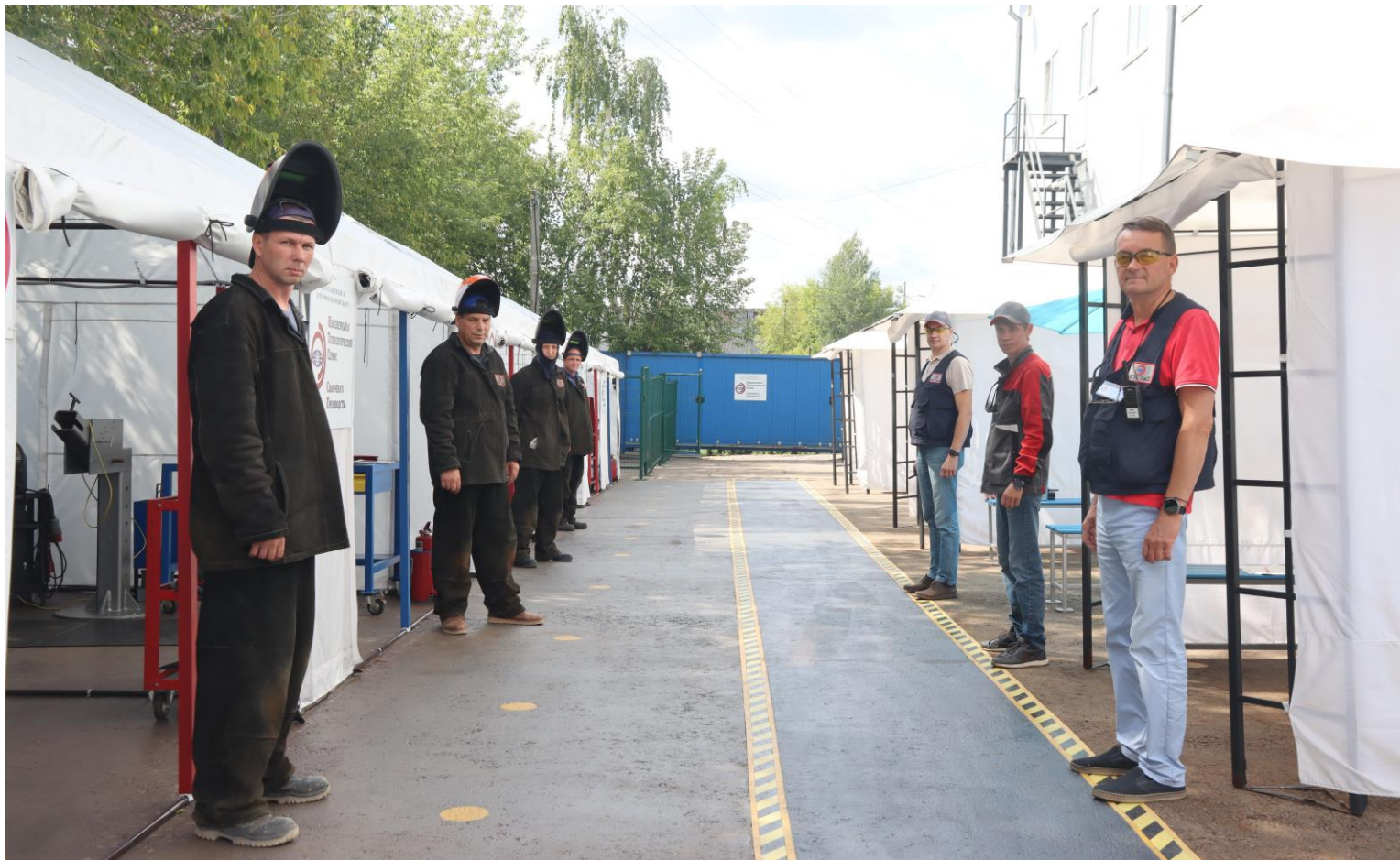
Проведение практического этапа профессионального экзамена путем сварки контрольных сварных соединений (КСС) в инвентарных укрытиях (сварочные палатки) на открытой производственной площадке «Испытательного центра»